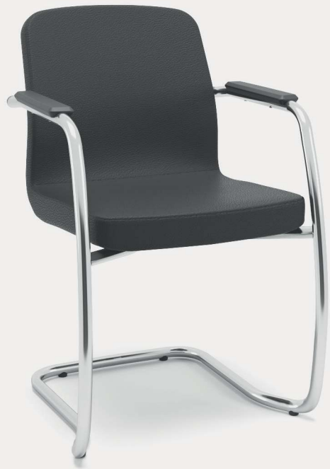
Aproximação S 67003