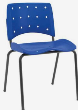
Fixa Slim 63001 (Montada) 63000 (Desmontada)