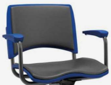
Assento e encosto estofados