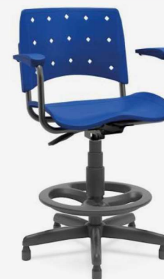
Secretária Caixa 37031