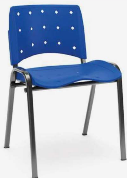
Fixa 34749 (Montada) 34532 (Desmontada)