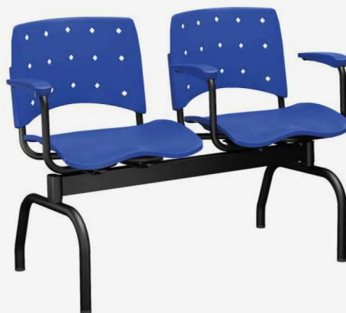
Longarina 53858 (Plástico preto) 53857 (Plástico cinza) 53859 (Metal preto) 53860 (Metal cinza) 54412 (Metal preto e cromado) 53861 (Metal cromado)